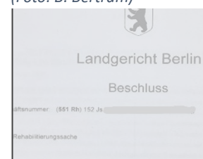
Strafrechtlicher Rehabilitierungsbeschluss des Landgerichts Berlin