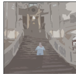
Rehabilitiert! Glückliche Klientin nach einer Anhörung im Kammergericht Berlin